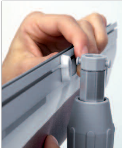
Panel einhängen, Teleskopstange auf die gewünschte Höhe ausfahren – fertig.