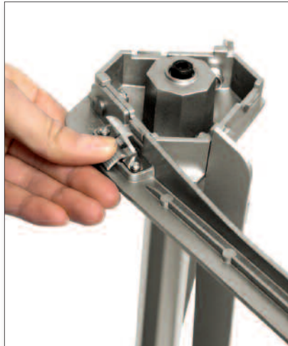
Standfest: Die drei Füße müssen nur ausgeklappt und arretiert werden.

Kombination von vier Panelbreiten sowie des variabel ausfahrbaren Teleskopstabs ergeben sich vielfältige Gestaltungsmöglichkeiten. Natürlich kann das Pole System beidseitig mit Grafikpanels bestückt werden. Als Zubehör ist der 50 Watt starke Halogenstrahler „Premium“ für das Pole System erhältlich.